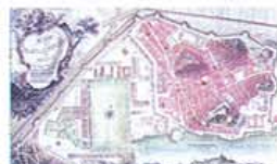
Plano del centro urbano de Cartagena.