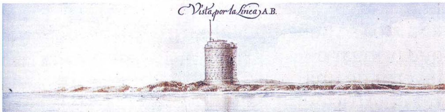
VIGÍA. Torre del Estacio, en La Manga, según el pincel naturalista de Juan José Ordovás. (IMÁGENES REPRODUCIDAS DEL ATLAS)